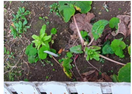
花壇にふきのとうが出ていました！

いよいよ6年生は卒業式まで残り3週間となりました。6年生との出会いは3年前。4年生運動会のソーラン節での雄姿が頭に浮かびます。法被の背中には自分で選んで自分で書いた漢字1文字。名前前の1文字を選んだ人、「夢」など好きな1文字を選んだ人。保護者の皆さんは、「うちの子はこの字を選んだのか」と嬉しいだろうな、大きな演技や元気いっぱい掛け声に、我が子の成長を感じて嬉しいだろうな、と思いました。5年生音楽会で合奏した「ルパン三世」。すごい迫力で格好良かったです。下出先生が職員室で仕事をしている時、結構な頻度で鼻歌が出ていました。(恐らくご自身は無意識だったと思いますが。)それを何度も聞いていた私。ある時から自転車での通勤中にルパン三世の鼻歌が出るようになってしまいました。一度、信号待ちの交差点で無意識に鼻歌が出ていて、はっと気づいた時には周りにたくさんの方がいて、「今の、絶対に聞かれていたよね？」とすごく恥ずかしい思いをしたことがありました。それくらい耳と心に残る演奏でした。6年生音楽会の合唱「Let's search for tomorrow」も良かったです。特に合奏「アフリカンシンフォニー」では鳥肌が立ちました。在校生や保護者からの「アンコール！」が忘れられません。運動会も「さすが6年生！」演技や競技、応援、係の仕事など様々な場面で格好良い姿を見せてくれました。「特掃班(とくそうはん＝特別掃除班)断捨離部隊・草取り部隊」の活躍。6年生が学校のためにと頑張る姿に、何人もの下級生が「僕も(私も)手伝う！」と言ってくれました。他にも、「学校のために何かできることはないかな」と考えて行動に移せる人が現れ、それがクラスや委員会へと広がっていったこと、嬉しく頼もしく感じました。