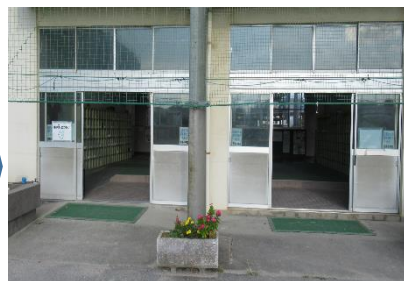
昇降口で、受付番号札の配布をさせていただきます。